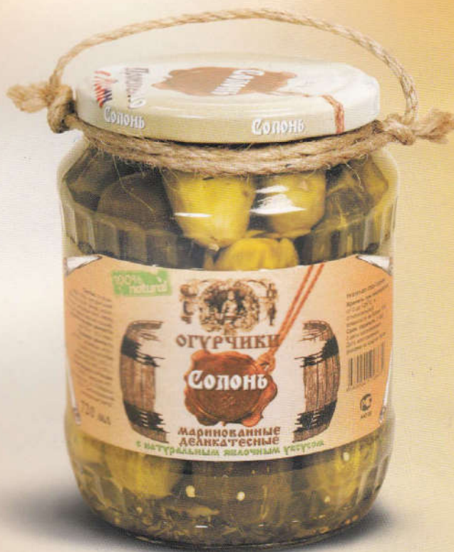
Солонь Огурчики маринованные деликатесные с натуральным яблочным уксусом 720 мл