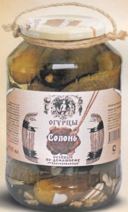
Солонь Огурцы соленные по-домашнему 1500 мл