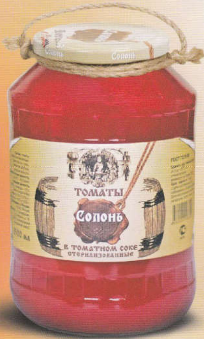
Солонь Томаты в томатном соке 1500 мл