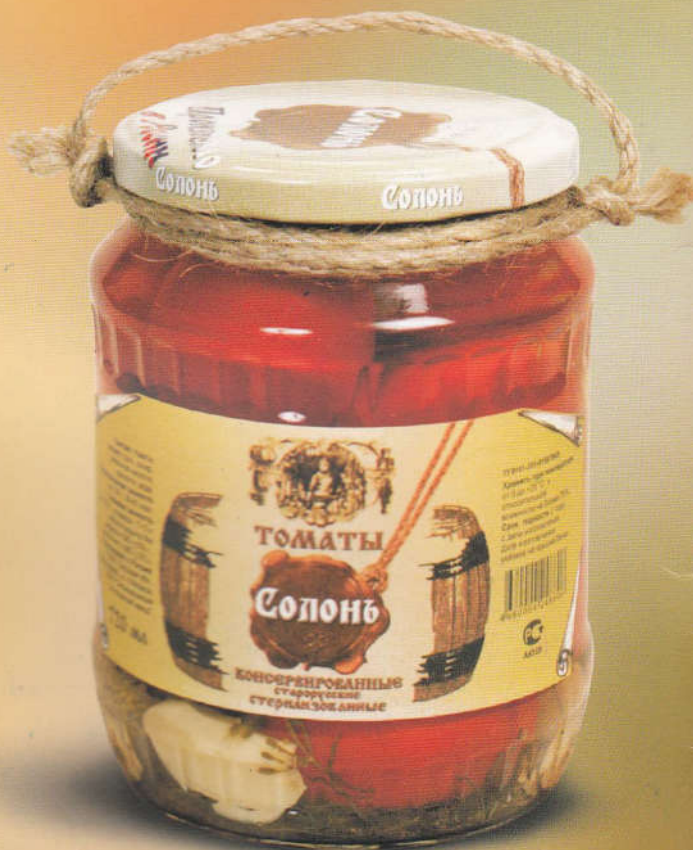
Солонь Томаты консервированные старорусские 720 мл