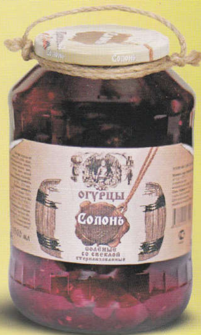
Солонь Огурцы соленые со свеклой 1500 мл