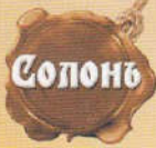
Солонь Огурцы консервированные по-старорусски 720 мл