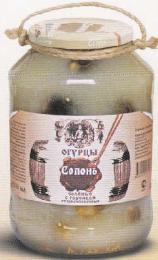
Солонь Огурцы соленные с горчицей 1500 мл