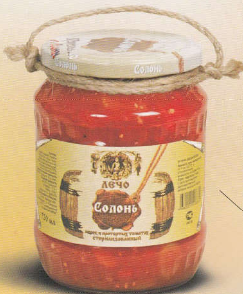
Солонь Лечо. Перец в протертых томатах 720 мл