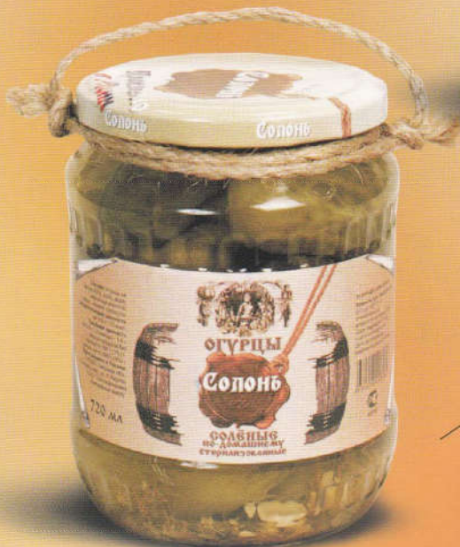
Солонь Огурцы соленые по-домашнему 720 мл