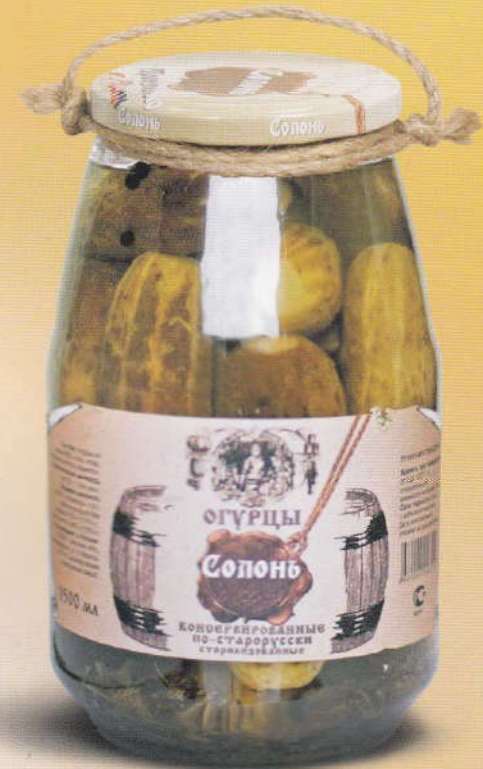
Солонь Огурцы консервированные по-старорусски 1500 мл