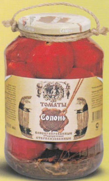
Солонь Томаты консервированное старорусские 1500 мл