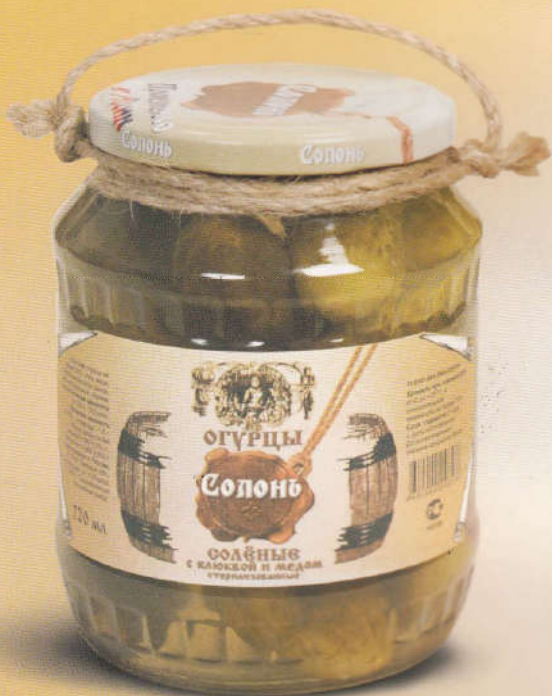
Солонь Огурцы соленые с клюквой и медом 720 мл