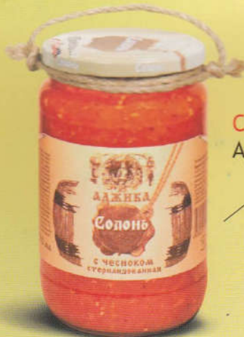
Солонь Аджика с чесноком 350 мл