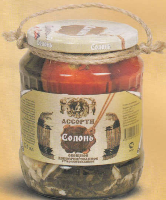
Солонь Ассорти овощное консервированное 720 мл