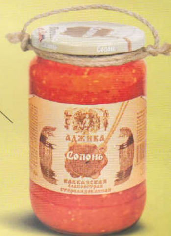
Солонь Аджика кавказская слабоострая 350 мл