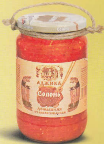
Солонь Аджика домашняя 350 мл